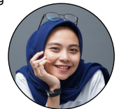
(Kontributor: Noviana P – PT Rolas Nusantara Medika)

"Kedepannya, kami akan membuat logo IHC dengan member dan manage by yang akan berguna untuk menambah nilai jual seluruh unit yang akan bekerja sama dan bergabung bersama IHC," ucapnya.