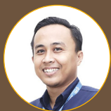
(Kontributor: Bayu Setiawan – RS Perkebunan Jember Klinik)

Melalui seminar ini RS Perkebunan Jember Klinik berharap para peserta dapat menerapkan pengetahuan baru yang mereka peroleh dalam praktik sehari-hari, sehingga mampu memberikan pelayanan terbaik dan memberikan kontribusi nyata dalam meningkatkan keselamatan dan kesehatan ibu dan bayi.