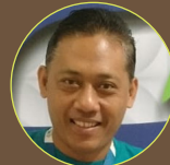
(Kontributor: Priyadi – RS Medika Utama)